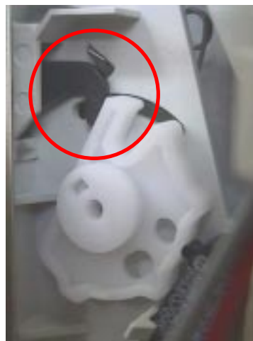
Came na posição incorreta (não aciona a chave com porta fechada)