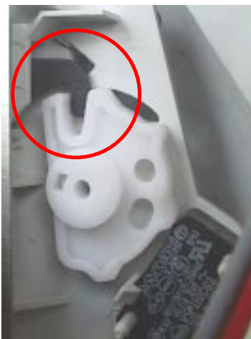
Came na posição correta (chave acionada com porta fechada)