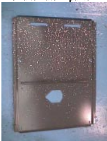
Parte Interna do Conjunto Traseiro Esmalte Autolimpante