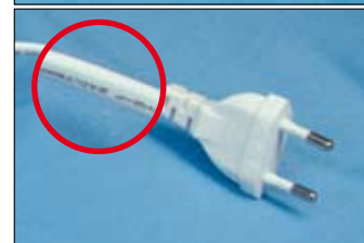
O cordão da foto de cima (Britânia, eliminado) não tem a cobertura de proteção que aparece abaixo (Faet).