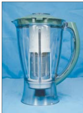
Faet Dulka: a presença do filtro não ajudou no desempenho.

Será que os fabricantes ficam à vontade para manter no mercado produtos com desempenho fraco, inseguros e barulhentos porque o cumprimento da norma é voluntário? Será que apenas a PRO-TESTE vê isso? Por que produtos que ameaçam a segurança do consumidor permanecem no mercado? Quem pode nos responder?